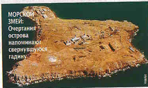
МОРСКОЙ ЗМЕЙ: Очертания острова напоминают свернувшуюся гадюку

ВХОД В ЧИСТИЛИЩЕ: В руковетном подземном монастыре под Черниговом открыты для посещения тайные комнаты освобождения от плоти