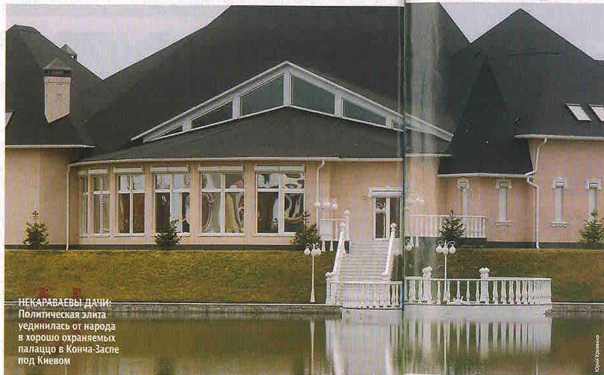
НЕКАРАВАЕВЫ ДАЧИ: Политическая элита уединилась от народа в хорошо охраняемых палатках в Конча-Заспе под Киевом

Как гласит поговорка, стыдно — у кого видно. У украинской элиты ее роскошь как бы незаметна, ведь никто официально не признает, что живет в этом Санрайзе. Хотя здесь угнездились почти все. Нет тут только Президента: Виктор Ющенко предпочел осесть чуть в стороне, километрах в пяти дальше от берега, в Новых Безрадячах.