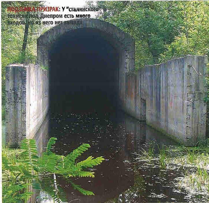
ПОДЪЕЗД К ТИЗРАК: У “Сталинского туннеля” под Днепром есть много входов, но из него нет выхода