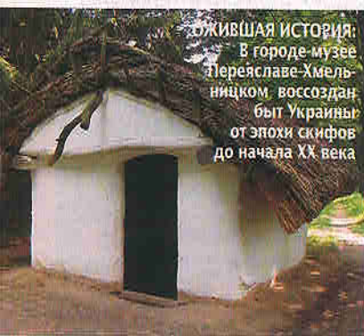
ОЖИВШАЯ ИСТОРИЯ: В городе-музее Переяславе-Хмельницком воссоздан быт Украины: от эпохи скифов до начала XX века

Такого количества музеев, как в Переяславе-Хмельницком, нет ни в одном украинском городе, правда, за исключением Киева. Но и здесь старинный район опережает столицу. Как шутят жители Переяслава, у них почти на каждую тысячу населения по музею (всего их 27) — они объединены в Национальный историко-этнографический заповедник.