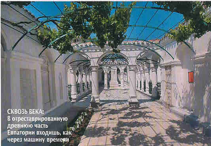
СКВОЗЬ ВЕКА: В отреставрированную древнюю часть Евпатории войти, как через машину времени

родить атмосферу седой старины. Например, на реконструкцию Соборной кенасы караимов город потратил 1,6 млн грн. Каменная терраса теперь выглядит в точности, как на старинном музейном фото, где по ней прогуливается император Николай II, и современный путешественник может почувствовать себя вне времени. Узенькие улочки Старого города, по которым не проехать автомобилю, с нависающими балконами древних, но аккуратно отреставрированных домиков, напоминают о том, что раньше никто и слыхом не слышал, что бывают силы больше одной лошадиной.