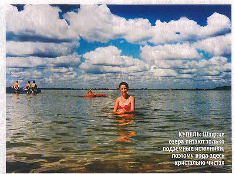
КУПЕЛЬ: Шацкие озера питают только подземные источники, поэтому вода здесь кристально чистая

Тишина, гладь озер, воздух хвойных лесов — далеко не полная картина Шацких озер в Волынской области, одной из самых солидных озерных групп Европы. Самое большое и самое известное из двух десятков местных озер — Свитязь (площадь — более 26.000 га, глубина — 58 м) находится неподалеку от городка Шацк. Это озеро глубже Азовского моря и знаменитого "морского ока Карпат" — Синевира. Его питают исключительно подземные источники, поэтому вода настолько чистая и прозрачная.