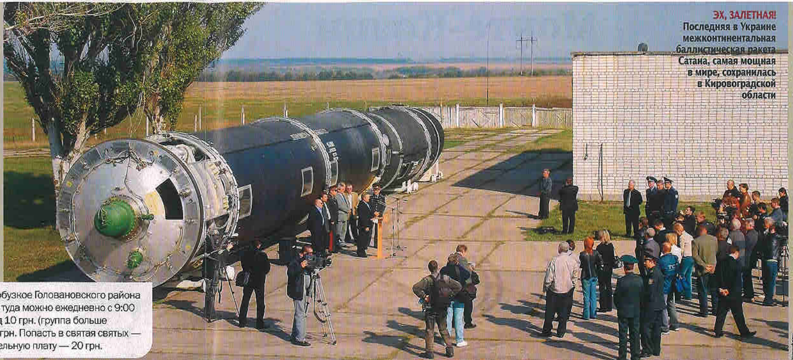
ЭХ, ЗАЛЕТНАЯ! Последняя в Украине межконтинентальная баллистическая ракета Сатана, самая мощная в мире, сохранилась в Кировоградской области

Место дислокации — поселок Побузок Головановского района Кировоградской области. Попасть туда можно ежедневно с 9:00 до 17:00. Взрослые платят за вход 10 грн. (группа больше 15 человек — по 7 грн.), дети — 2 грн. Попасть в святая святых — командный пункт — можно за отдельную плату — 20 грн.