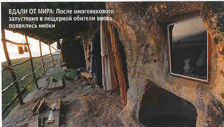
ВДАЛИ ОТ МИРА: После многовекового запустения в пещерной обители вновь появились иноки

Второй монастырь — Мангуп — поменьше, человек на шесть. Зато местность вокруг поинтересней: остатки древнего одноименного города, столицы разрушенного турками в XV веке христианского