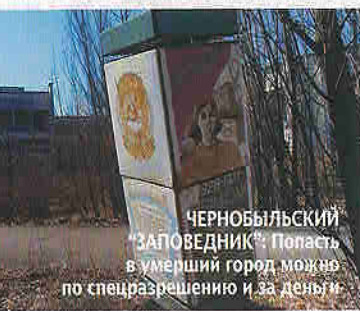
ЧЕРНОБЫЛЬСКИЙ ЗАПОВЕДНИК: Попасть в умерший город можно по спецразрешению и за деньги

Искать монастыри надо примерно на полпути между Симферополем и Севастополем. Чтобы ощутить ладонями шершавость их стен и прикоснуться к святым мощам, нужно, помимо желания, немного силы в ногах и немного денег в кошельке ($ 20 в день — с едой и услугами проводника от Симферополя).