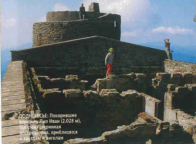
ПОДНЕБЕСЬЕ: Покорившие вершину Пип Иван (2.028 м), где стоит старинная обсерватория, приближаются к звездам и ангелам

Обсерватория на горе Пип Иван (или Черная), Прикарпатье