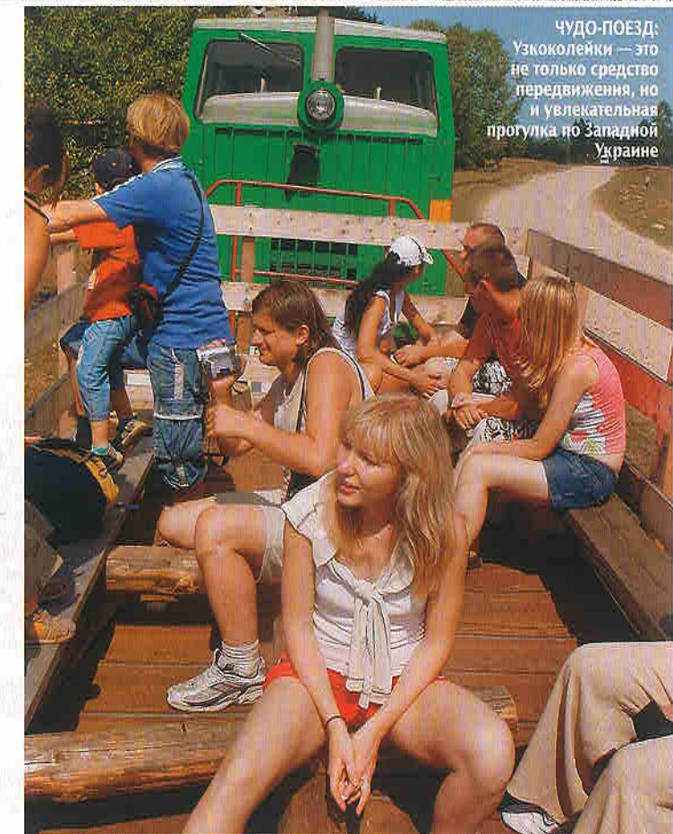
ЧУДО-ПОЕЗД: Узкоколейки — это не только средство передвижения, но и увлекательная прогулка по Западной Украине

Тему номера подготовили: Дмитрий Громов, Андрей Смирнов, Алексей Шевченко, Екатерина Чухлиб, Павел Глумин, Катерина Панова, Каролина Тымкив, Наталья Самсоненко